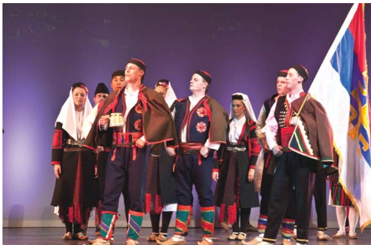
Koncert SKUD-a Oplenac 31 maj 2009, Mississauga Living Arts Centre