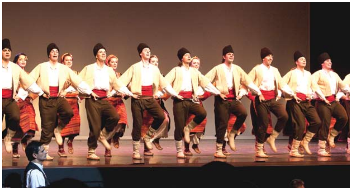
Koncert SKUD-a Oplenac 31 maj 2009, Mississauga Living Arts Centre

cele Sjedinjene Američke Države, kao najmladji u ansamblu igrao u Carnegie Hall u Njujorku, na sceni gde pre toga niko od svetskih folklornih trupa nije nastupao, Kennedy Center u Washington DC i ostalih prestižnih dvorana na ovom kontinentu). Studentski dani su me odveli u Krsmanović, ljubav i posvećenje srpskoj tradicio-