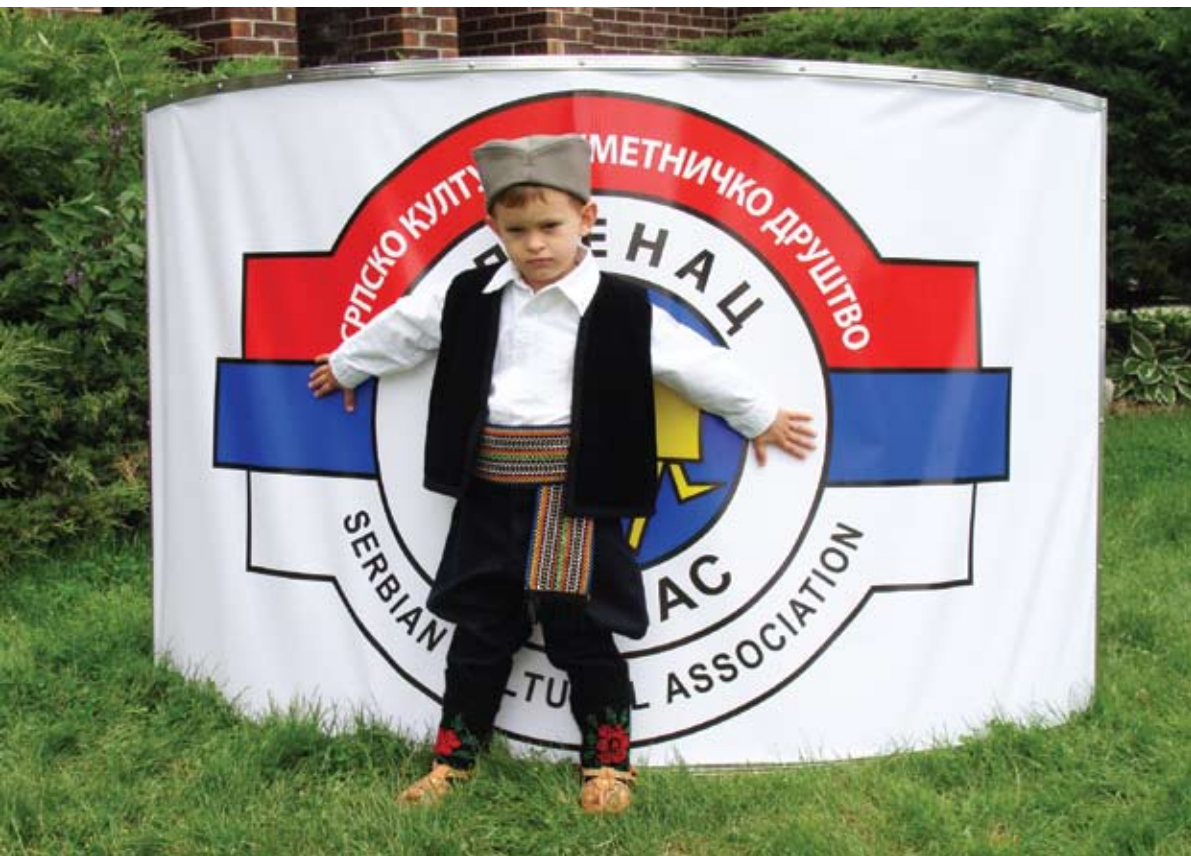
Ispred zgrade SKUD-a Oplenac, 13 jun 2009