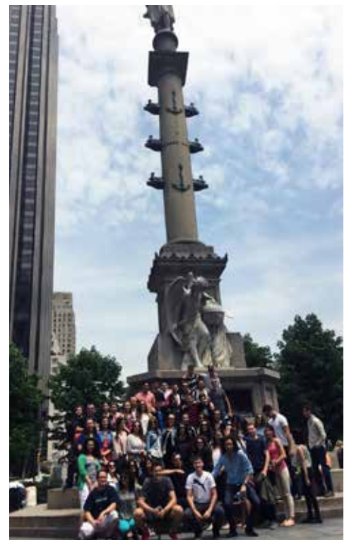
New York, Maj 2015