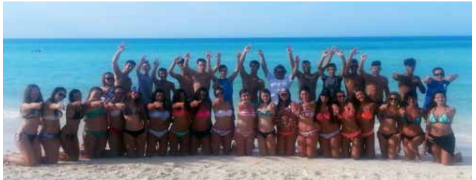
Kuba, Mart 2016

Tokom poslednjeg koncertnog putovanja u New York ostao mi je u lepom sećanju momenat kada sam po izlasku iz Lincoln tunela po prvi put ugledala siluete svih zgrada na horizontu. Posle toga mi se sve činilo tako uzbuđljivo dok smo prolazili kroz već uhodanu dinamiku putovanja, žuri u hotel, prijavi se, zgrabi mapu i kreni na razgledanje grada i okoline da ne gubimo ni minut, ali pazi da se ne umoriš pred koncert. Kao i uvek na ovakvim putovanjima znamo da nam za koncert treba