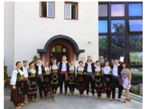
Pevači Rep ansambla posle snimanja ispred RTS, Srbija 2015

Sledeća destinacija nam je Vankuver u maju 2016. Nadam se da ćemo i ovaj put biti uspešni i da ćemo se lepo provesti. Znajući svoje prijatelje iz ansambla nekako u to uopšte ne sumnjam.