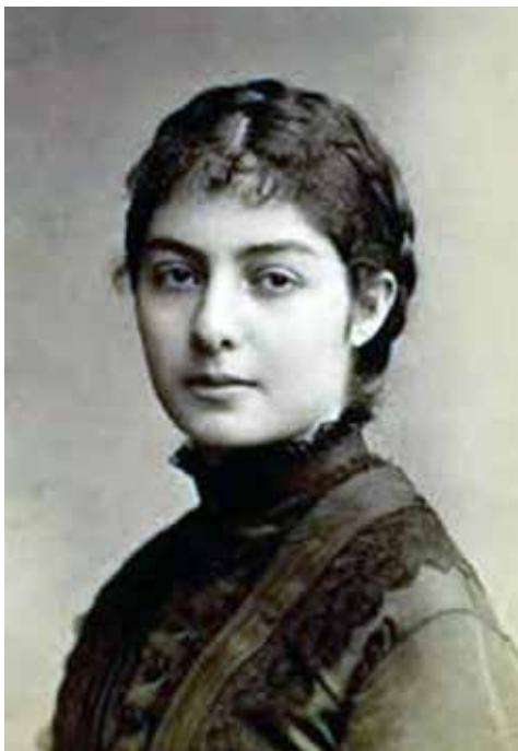
Kraljica Natalija Obrenović

Sin je bio budući prestolonaslednik Aleksandar Obrenović. Samo nekoliko godina