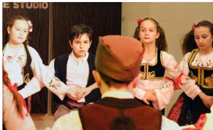
Deca u kolu Oplenac, mart 2016

rekciju programa i rada Oplenca. Svojom školovanjem stekao je diplomu pedagoga i specijaliste za tradicionalnu igru, a njegov umetnički talenat kao i dugogodišnje igracko i radno iskustvo obeleženo nagradama i priznanjima uvrstili su ga u grupu najkvalitetnijih srpskih koreografa mlađe generacije.