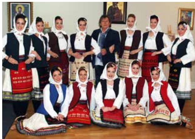
Članice Rap ansambla sa Radojicom u Oplencu

ven način, dok izgovaramo reči, radujemo se onome što nam život donosi i pruža, kada smo zabrinuti i puni očekivanja i nadanja, kada uživamo u svim uspesima pojedinca ili grupe ljudi iz naše zajednice i okruženja, kada žalimo za onima koji nas napuštaju... Sve to radimo na načine koji se po ustaljenom pravilu prenose od roditelja na decu, od starijih članova porodičnog domaćinstva na mlađe naraštaje koji stasavaju i ulaze u život odraslih.