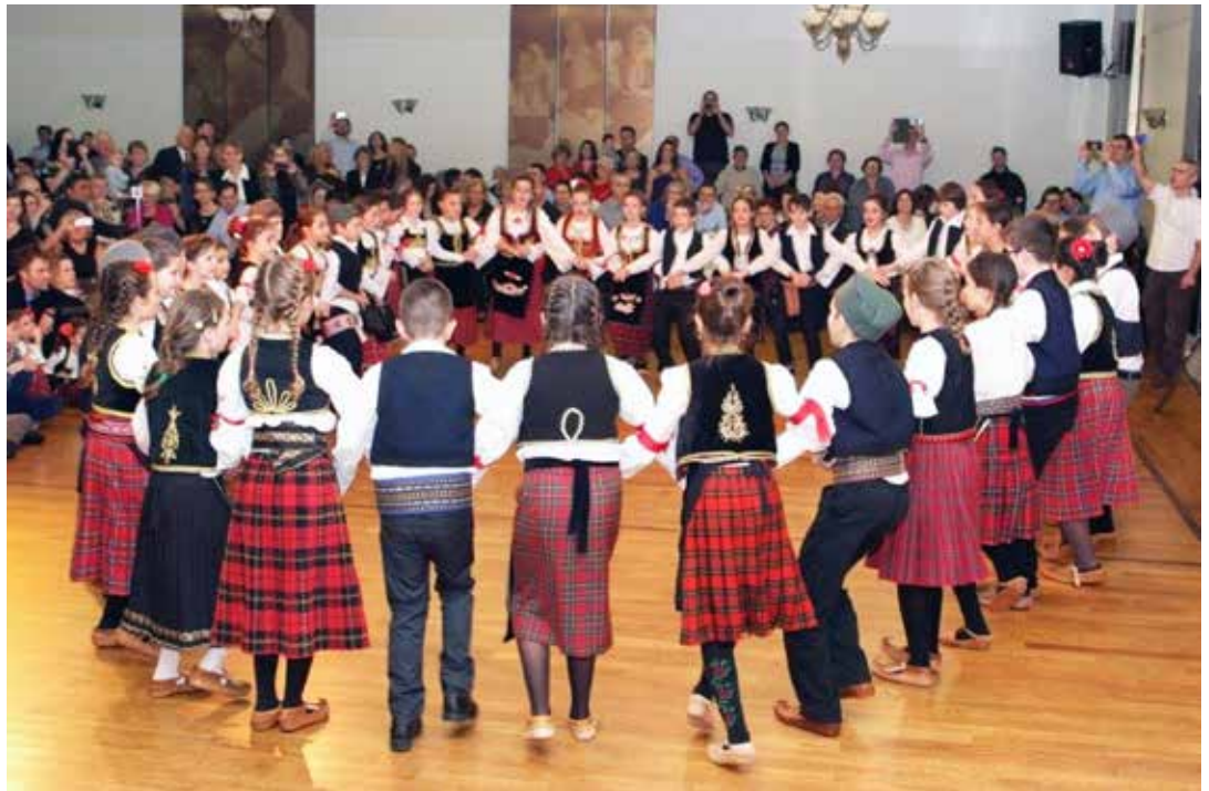
Dečji ansambl-nastup u Oplencu.