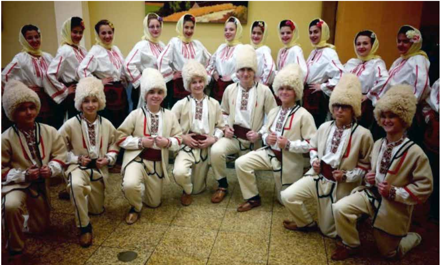
Treći dečji ansambl pred nastup u Waterloo, februar 2016